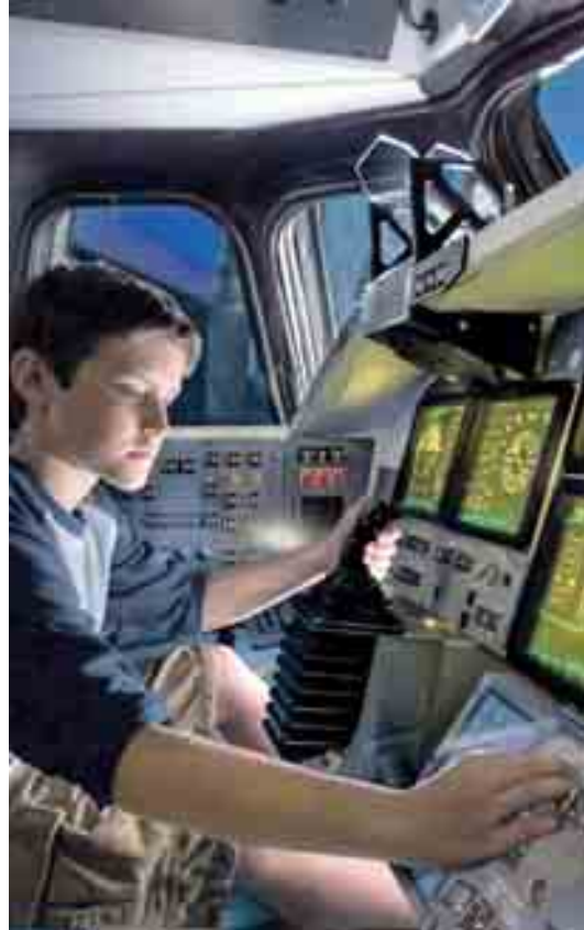
GUIDARE PER CREDERE Al volante di un Bulldozer o di un gommone superpotente, oppure davanti alla console di un simulatore di volo che riproduce le sensazioni degli astronauti ai comandi dello Space Shuttle: guidare resta una grande attrazione

Aumenta sempre di più la domanda di turismo "esperienziale", la nuova frontiera del tempo libero. Un giro sulla sabbia con un bulldozer o con una Ferrari sulla pista di Maranello sono in cima ai desideri di moltissimi viaggiatori. La parola d'ordine è: basta che non sia il "solito pacchetto"