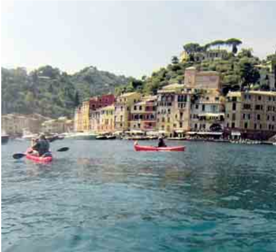
EMOZIONI FORTI Sotto, una delle Ferrari superpotenti con cui si può girare sulla pista di Maranello. Sopra, in kayak con la vista mozzafiato di Portofino