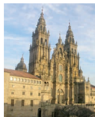
Santiago de Compostela

Firmato a Roma, durante un incontro organizzato dall'Opera Romana Pellegrinaggi, il protocollo relativo alla collaborazione tra la Regione Lazio e la Regione Galizia per la promozione del Cammino di Santiago de Compostela e le Vie dei pellegrini verso Roma nell'Anno Santo Compostelano, che si aprirà l'1 gennaio 2010. L'accordo tra la Galizia, dove si percorrono gli ultimi 100 km degli otto cammini verso Santiago, e il Lazio, dove si percorrono gli ultimi 100 km delle Vie verso Roma, prevede iniziative congiunte