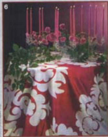
5, 6- Due pezzi delle collezioni di Marimekko, realizzati dalla designer Maija Isola: una borsa in stoffa a stampati di frutta e la tovaglia di Natale con motivi decorativi di fiori oversize .

(attualmente fiori e vegetali oversize ), declinati in una serie infinita di oggetti e materiali, colpiscono per l'audacia delle forme e dei contrasti cromatici. Nella zona di Kuusamo si trovano da Shopping Bjarmia , un negozio che s'incontra lungo la strada da Kuusamo a Ruka, dove si possono comprare anche tanti altri accessori e manufatti curiosi, come i cappelli tradizionali lapponi e le pelli di renna. Non lontano da qui, Pentik ( www.pentik.com ) offre il meglio dello stile scandinavo per la casa: dalle famose ceramiche ai vetri decorati, dai cuscini ricamati alle coperte e agli orsetti per bambini, il tutto nelle raffinate tonalità predominanti dell'azzurro polvere e del beige.