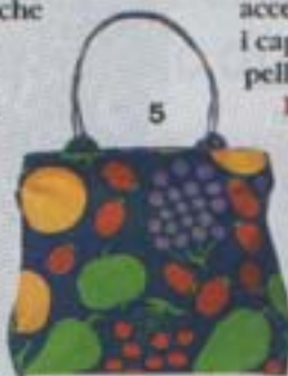
2003 Marimekko Oy